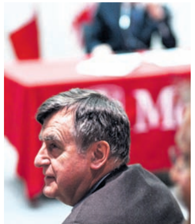
Le retour des Bouchards dans l'arène.