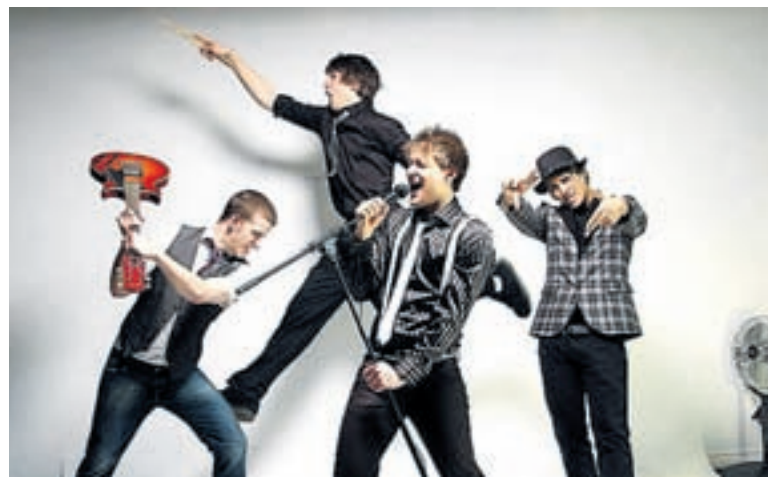
Gracieuseté de Truly Yours

personnelle de la musique, et cette nouvelle vague ne manquera pas de frapper de plein fouet le show business . Between the Lines est un album à découvrir. Merci. Ovation. Truly yours. ☺