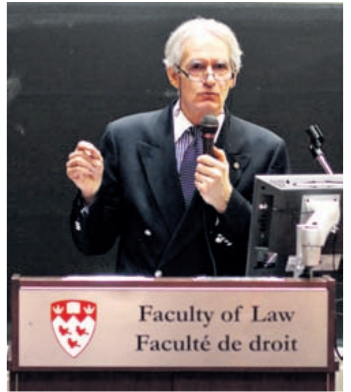
Gérard Bouchard, chef de file de l'interculturalisme.

Le fait est que les modèles d'intégration européens tel que le républicanisme d'assimilation en France et le laissez-faire multiculturel au Royaume-Uni font face à de nombreuses difficultés et sont en pleine mutation. Au Québec, plusieurs processus d'accommodements sont en cours, ce qui a provoqué une vague d'émotions ressentie autant dans la sphère publique que privée. Que le modèle interculturaliste soit valide ou pas, une chose est sûre, le débat autour de la laïcité de l'État est inévitable. ☉