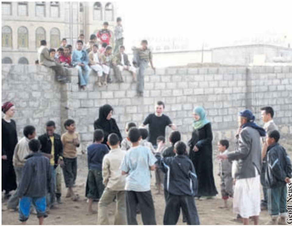
Xavier Plamondon Le Délit

Autrefois surnommé Arabia Felix –l'Arabie heureuse– par les Romains, le Yémen a récemment perdu le sourire. Depuis l'attentat manqué du underwear bomber le 25 décembre dernier, le Yémen a capté l'attention de tous les grands médias occidentaux et est devenu le nouveau bouc-émissaire des problèmes de sécurité mondiale. Cependant, s'il ne profite pas de l'élan offert par la communauté internationale, il pourrait se diriger illico vers la faillite.