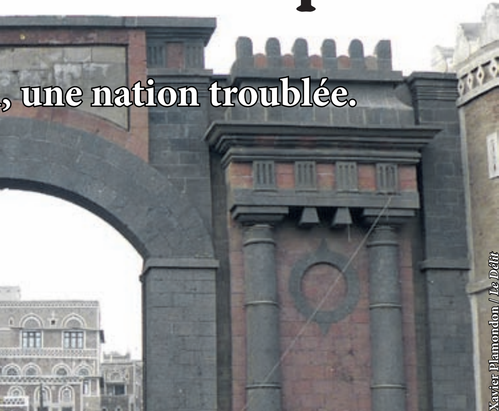
Xavier Plamondon / Le Défilé

aux médias occidentaux «de faire une montagne à partir d'un grain de sable. Quand je regarde les nouvelles sur les chaînes britanniques ou américaines, j'ai l'impression de vivre dans un autre pays. Certes, ils sont un défi à la stabilité du pays, mais ces combats sont isolés et n'affectent pas la majorité de la population.»