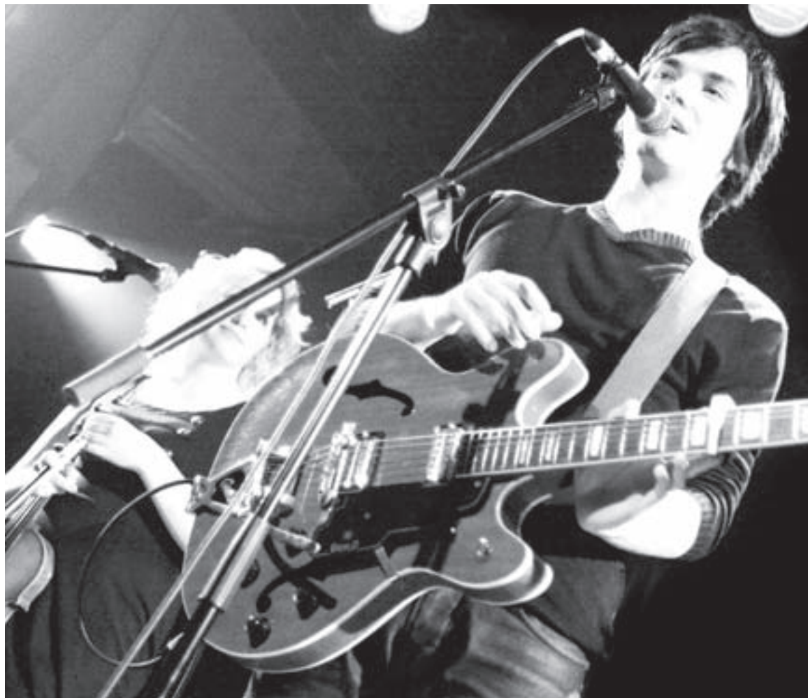
Le groupe Philémon Chante était en prestation lors de la soirée de préliminaires du 1 er mars dernier.

Chaque lundi, jusqu'au 22 mars, trois artistes s'affrontent dans la ronde préliminaire. Les